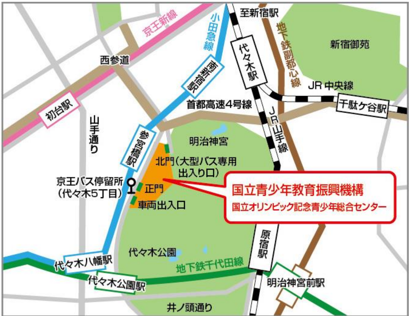
参宮橋からの [歩道橋] を使った経路